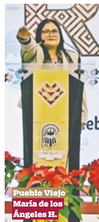
Pueblo Viejo María de los Ángeles H.